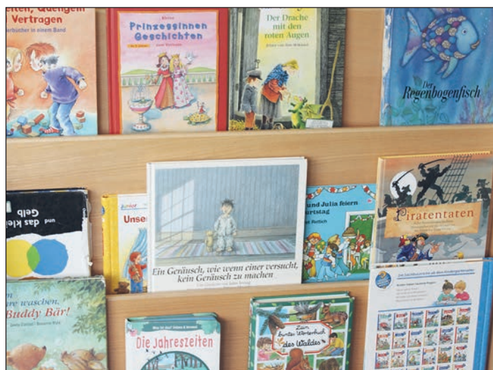
Das Bücherregal im Gruppenraum bietet wechselnden Lesestoff. Geschichten vorlesen und darüber sprechen gehört zum Bildungsprogramm in AWO-Kinderhäusern.

schichte Ähnliches erlebt wie der Zuhörer oder Leser, kann das sehr tröstend sein und möglicherweise Lösungsansätze für eigene Probleme bieten.